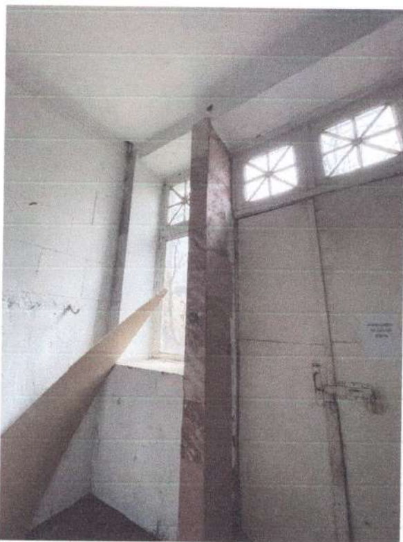
Автентичне заповнення вікон (вигляд в інтер'єрі)