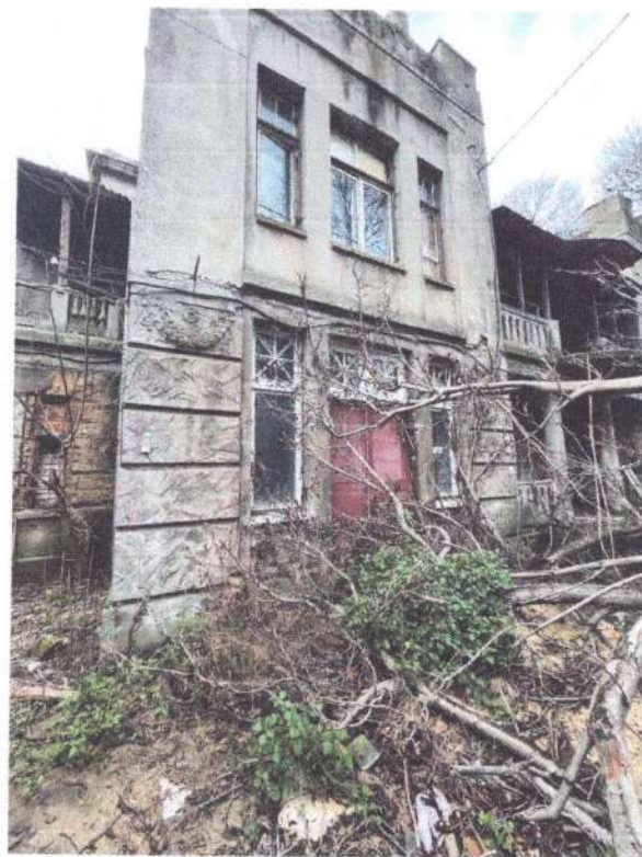
Автентичне заповнення вікон (вигляд в екстер'єрі)