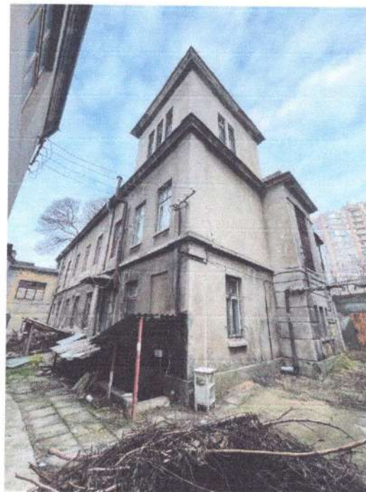
Дворові фасади пам'ятки

Будівля-пам'ятка, що знаходяться у власності Територіальної громада міста Одеси в особі Департаменту комунальної власності Одеської міської ради