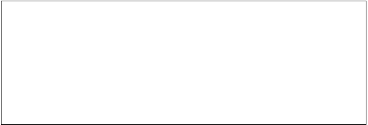
СХЕМА БЛАГОУСТРОЮ ПРИЛЕГЛОЇ ТЕРИТОРІЇ М 1:500