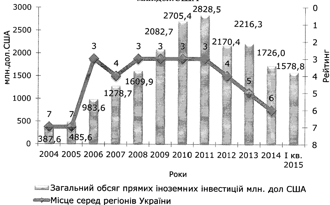
Динаміка рейтингу області серед регіонів України за загальним обсягом прямих іноземних інвестицій, млн.дол.США