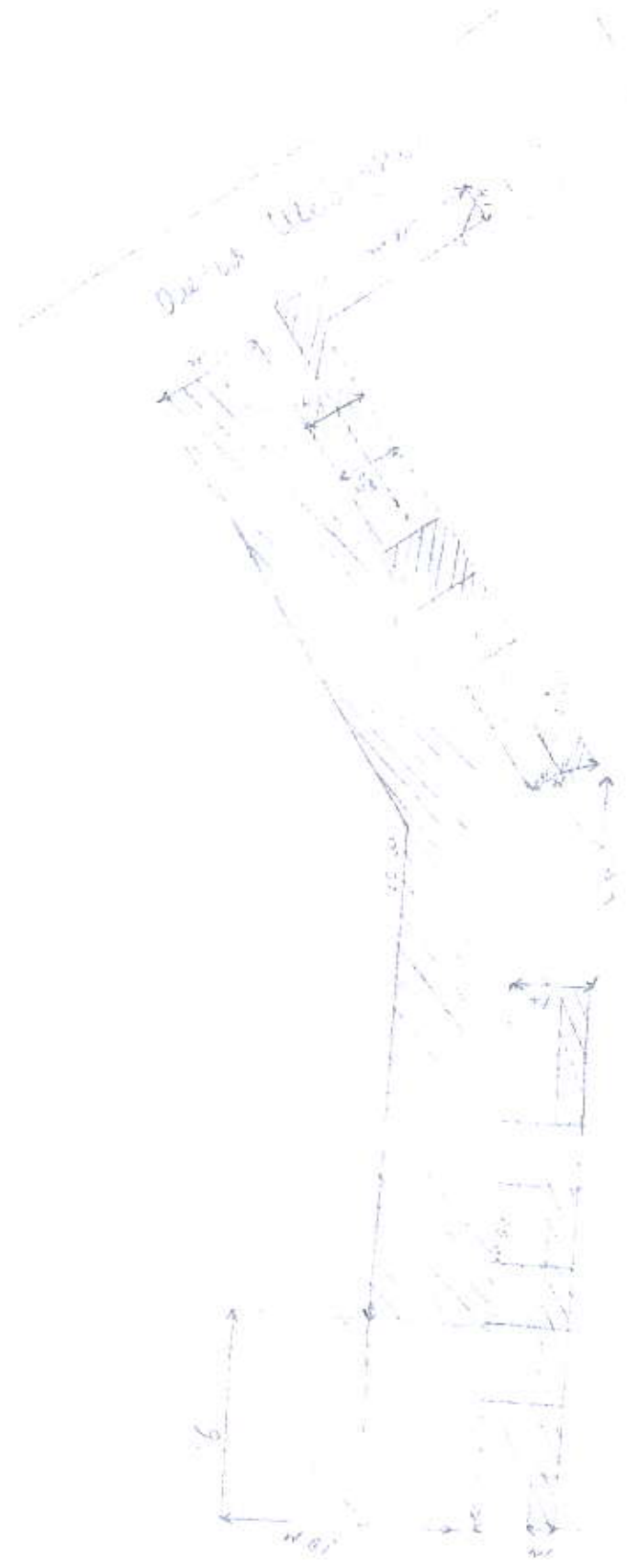
Схема № 20

Комплексная программа по развитию культуры в сельской местности на территории муниципального образования «Ильинский район» на 2010-2012 гг. Приложение к проекту «Ильинский район» № 8/20