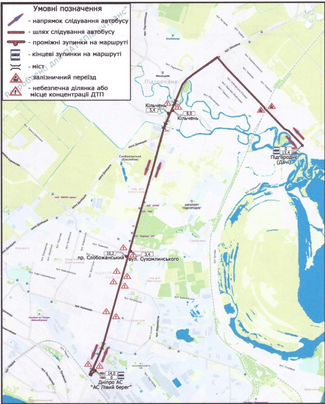
схема маршруту Дніпро (АС "Лівий берег") – Підгороднє (Дачі) Аркуш 1 Аркушів 2