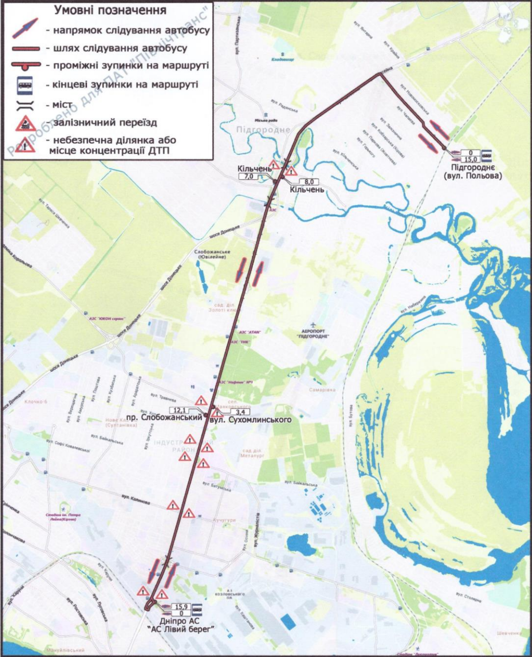
схема маршруту М 1:15 000 Підгороднє (вул. Польова) – Дніпро (АС "Лівий берег") Аркуш 1 Аркушів 2