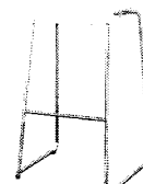
Високий стілець (барний)