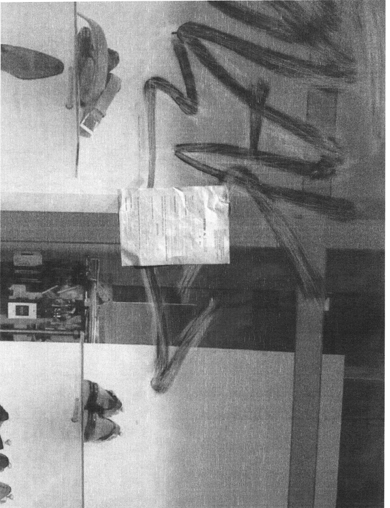
Солом'янський р-н, 1511862(1) 16.09.2015