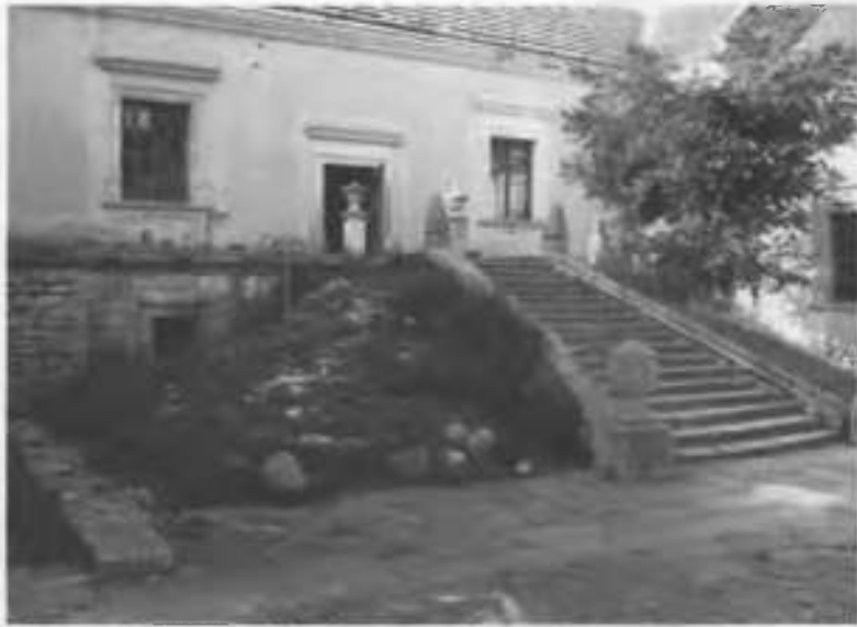
Рис.29. Парадні сходи північно-західний корпус верхнього двору.