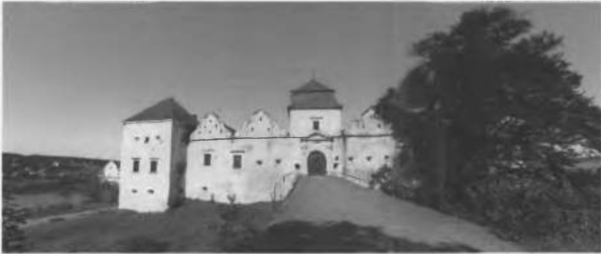
Рис.3. Вид на центральний вхід замку.