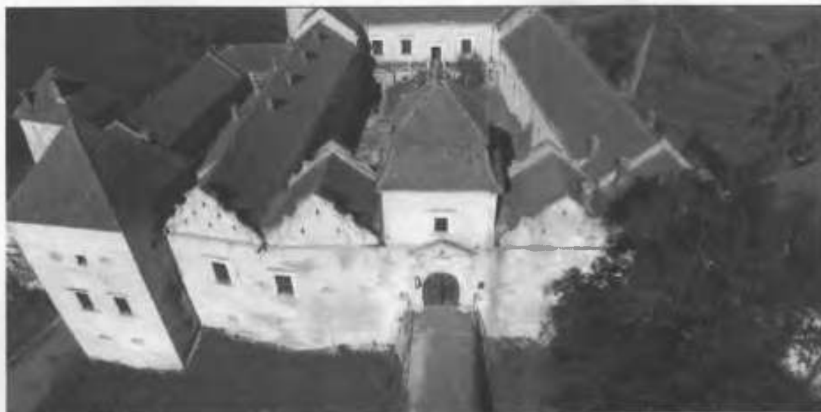
Рис. 9. Південно-східний корпус, центральна і південна башти.