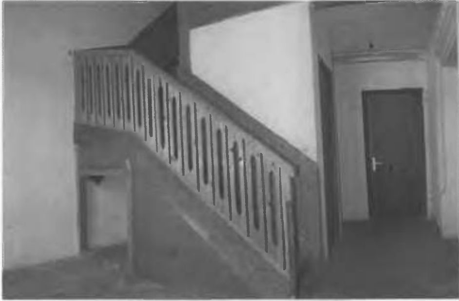
Рис.35. Фрагмент сходів в інтер'єрі.