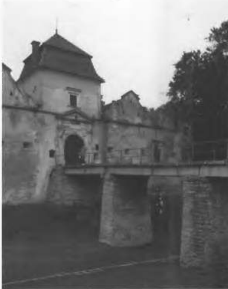
Рис.13. В'їзна вежа з брамою, до якої веде міст.