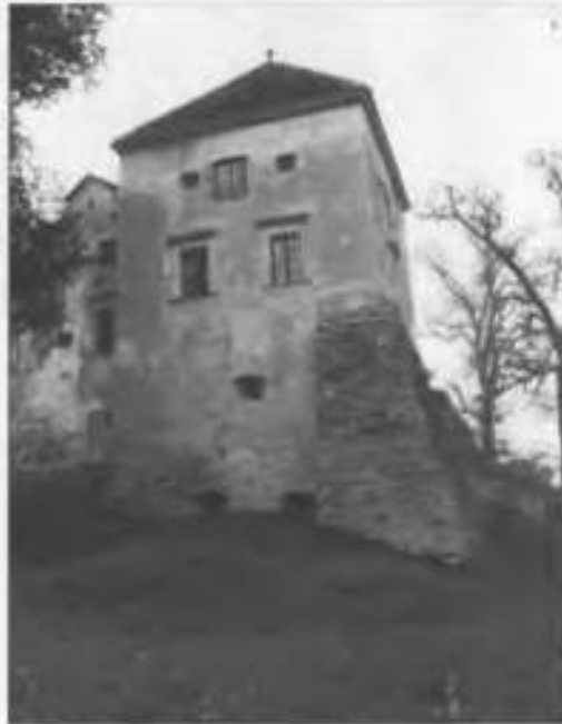
Рис.17. Східна башта.