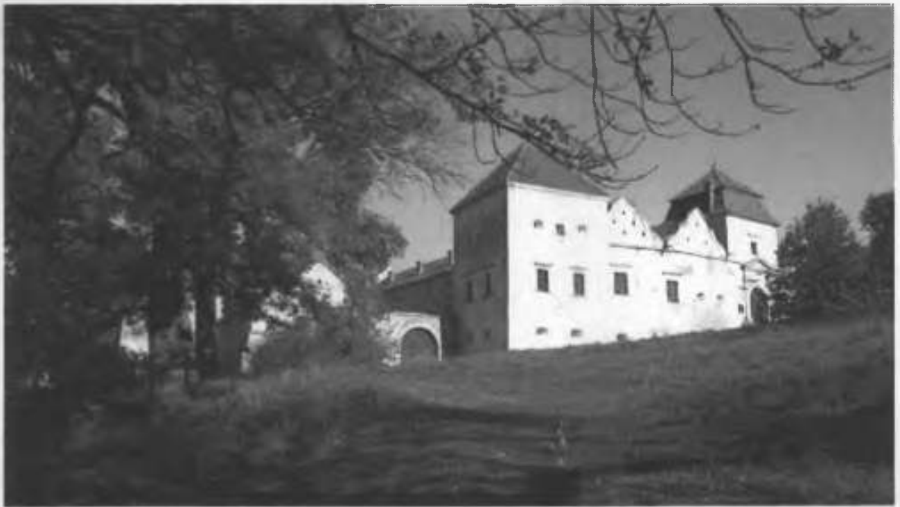
Рис. 6. Вид на центральний та західний фасад замку.