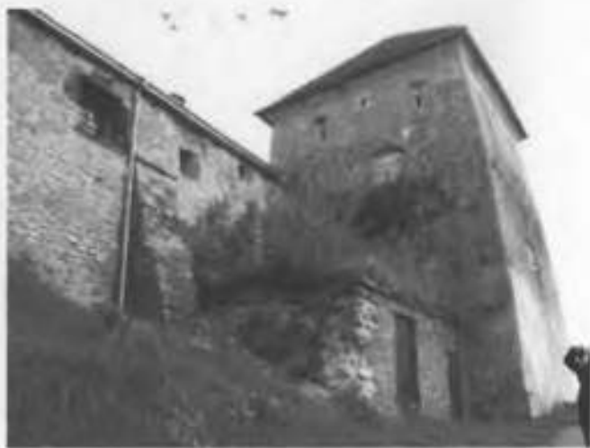
Рис.21. Південно-західний фасад.