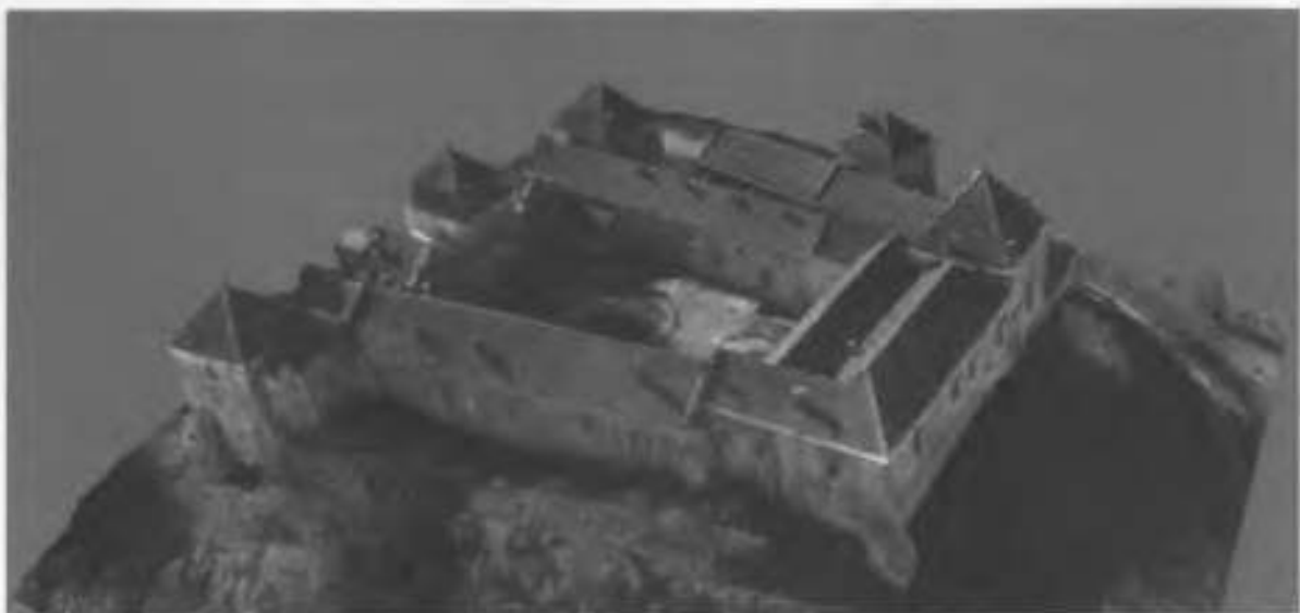
Рис.5. Вид на східний фасад замку. Просторова модель.