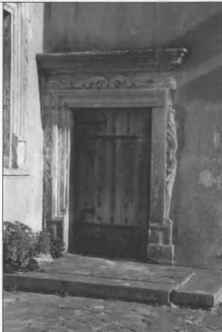
Рис.31. Вхід до південно-східного корпусу