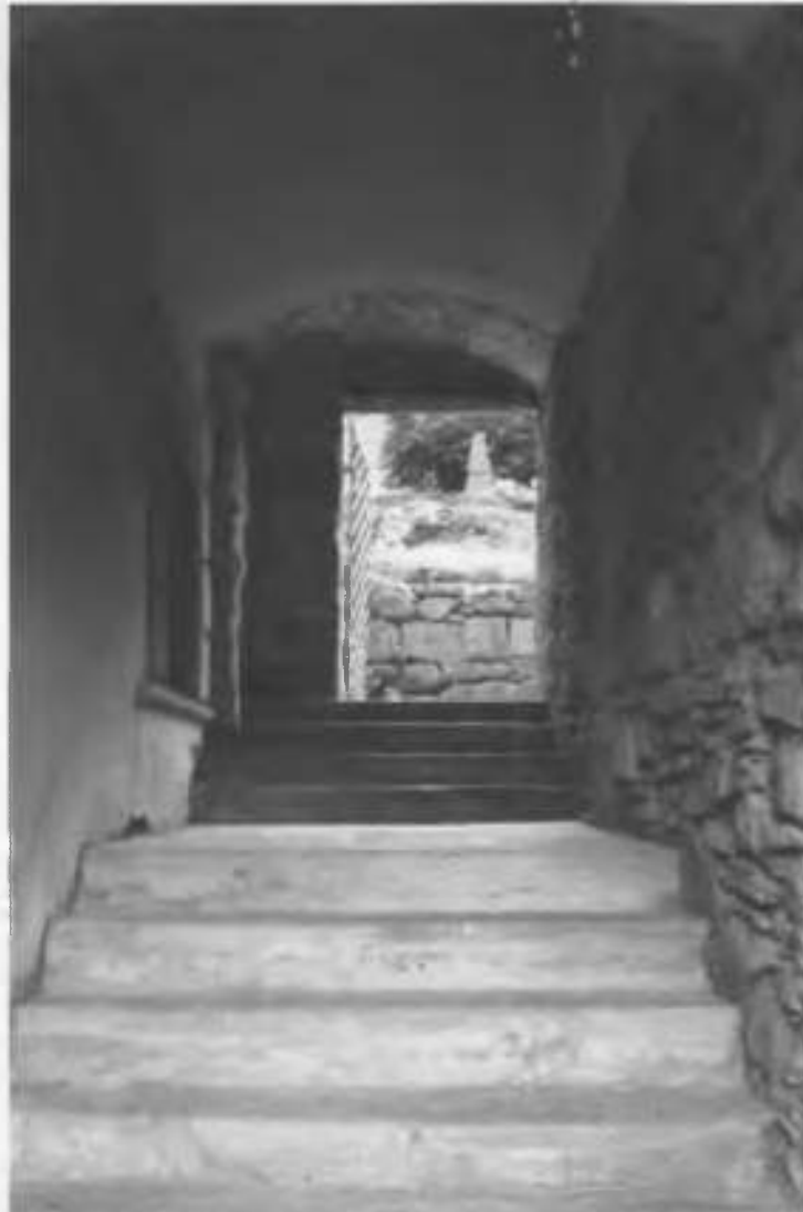
Рис.30. Прохід між двома дворами.