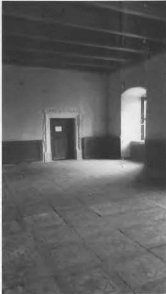
Рис.33. Фрагмент інтер'єру.