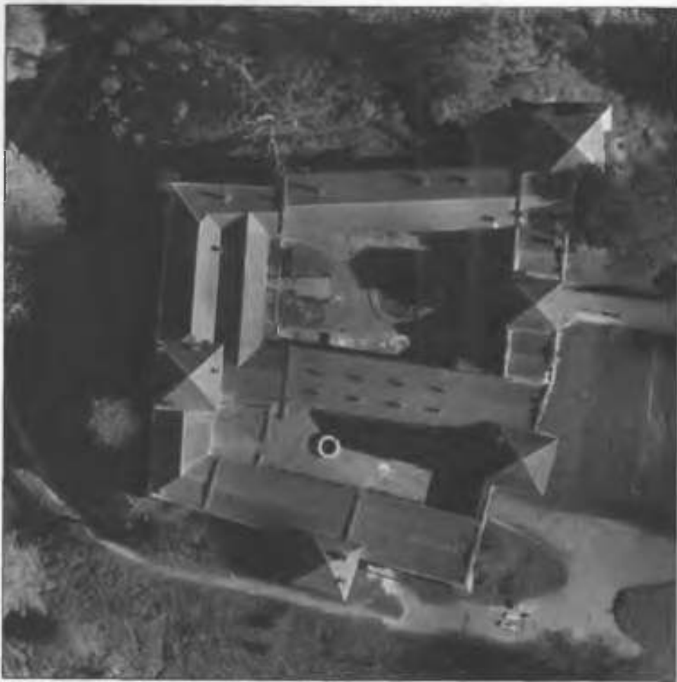
Рис 7. Аерофотограмметрія.