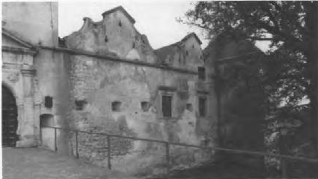
Рис.12. Загальний вигляд замку в осях 15-22.