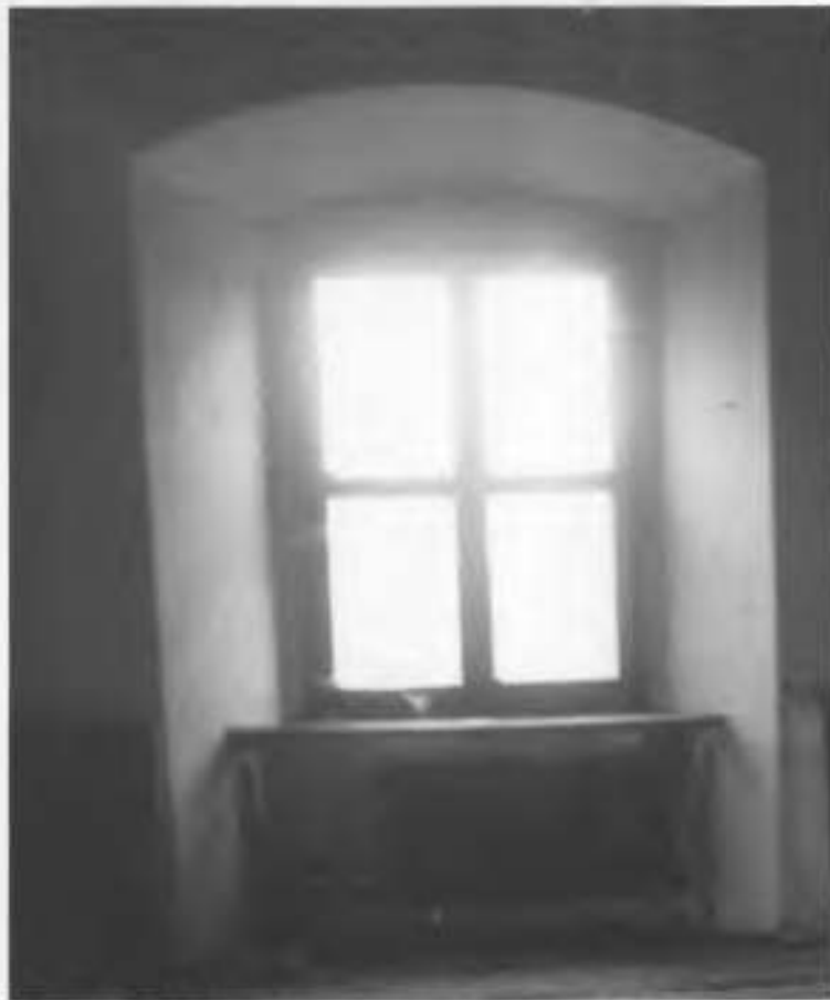
Рис.36. Фрагмент вікна в інтер'єрі.