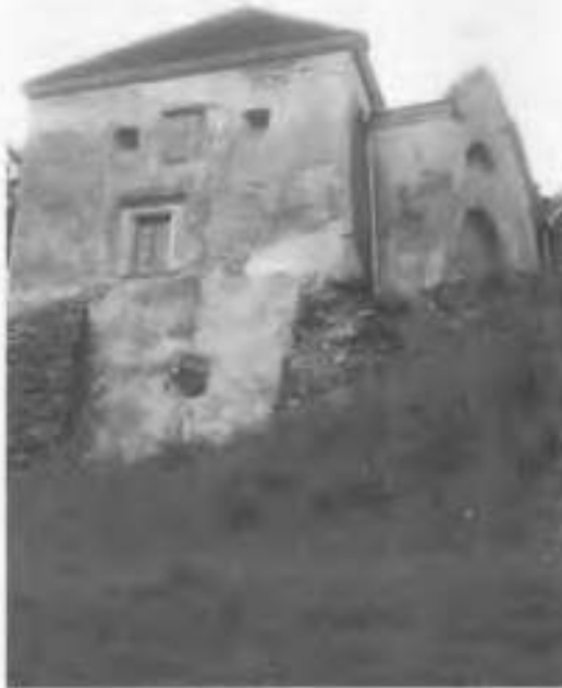
Рис.18. Східна башта з північно-східного фасаду.