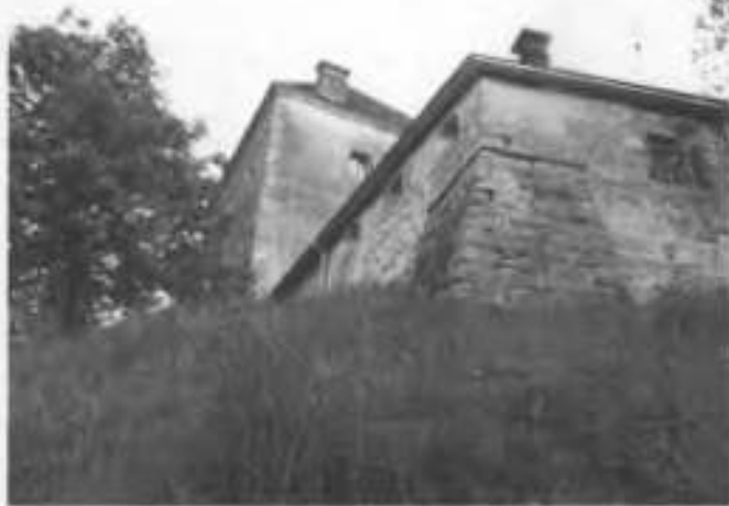
Рис.20. Західний кут замку.