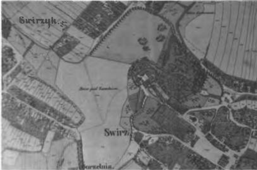
Рис.1. Фрагмент кадастрового плану Свіржа поч. XX ст.