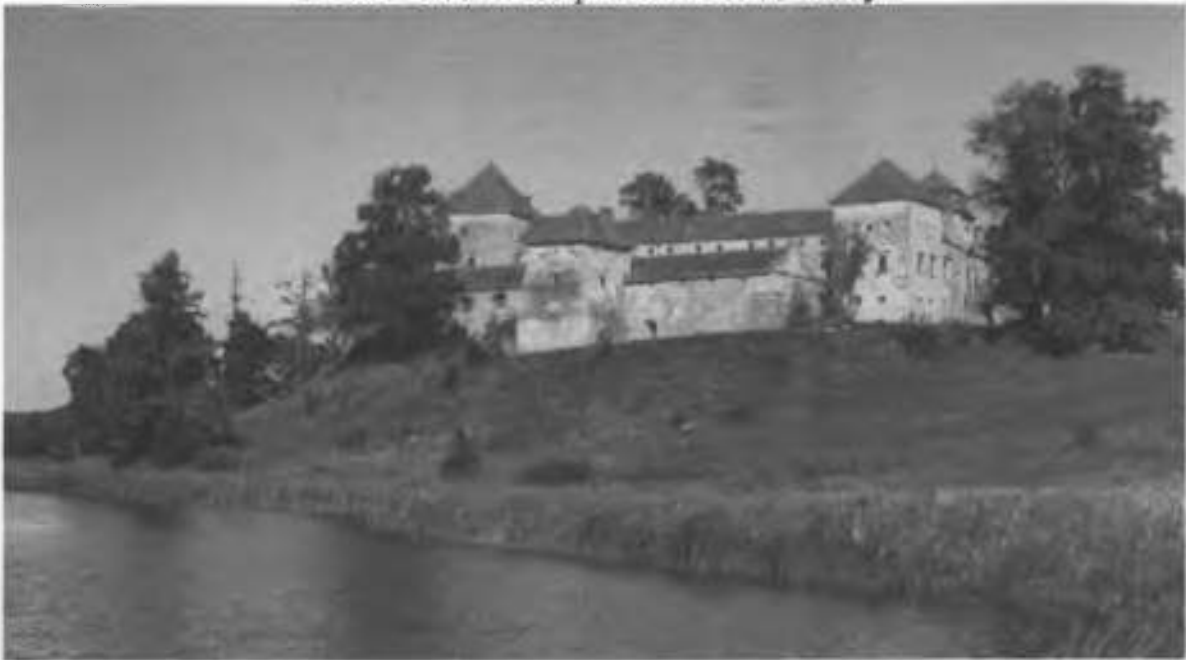
Рис.4. Вид на західний фасад замку з водойми.