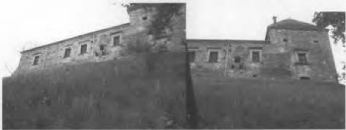
Рис.19. Північно-західний фасад, ліва та права сторони.