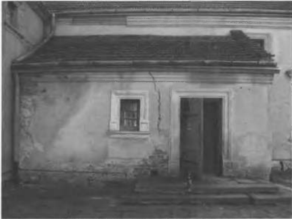
Рис.25. Тамбур центрального корпусу.