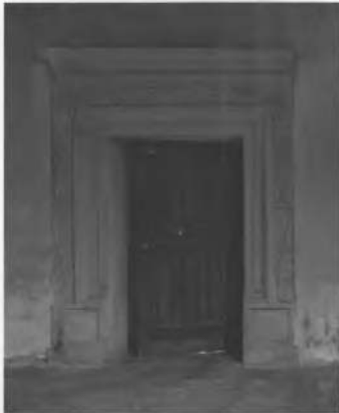
Рис.38. Фрагмент дверного порталу.