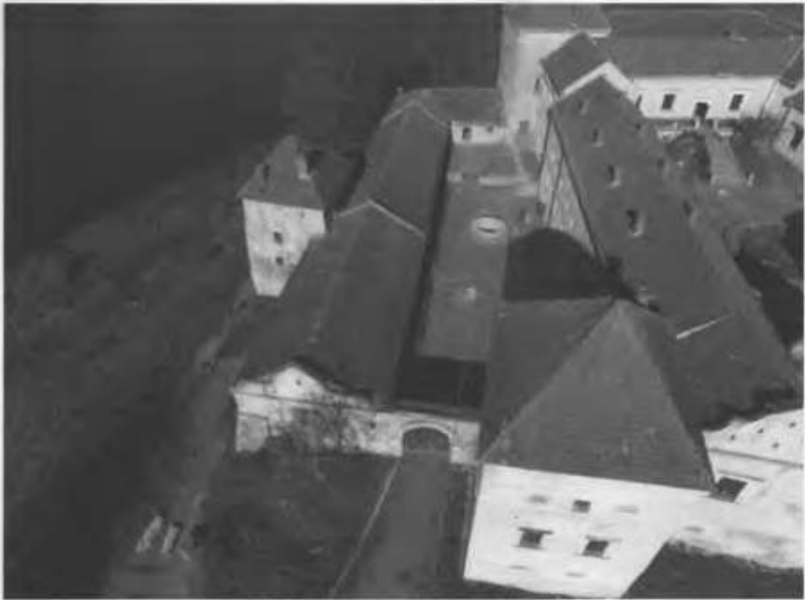
Рис. 15. Малий внутрішній двір.