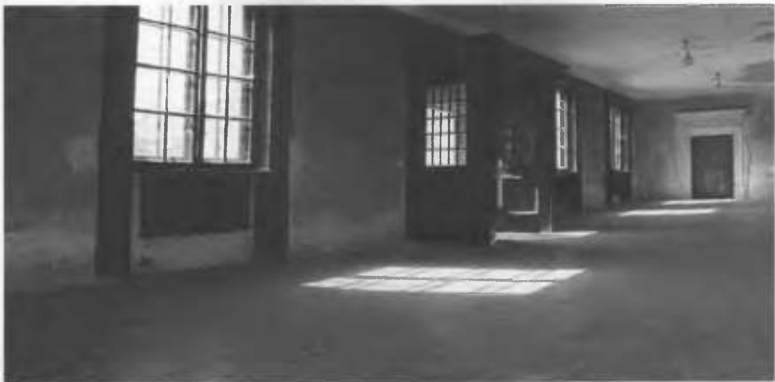
Рис.34. Фрагмент інтер'єру.