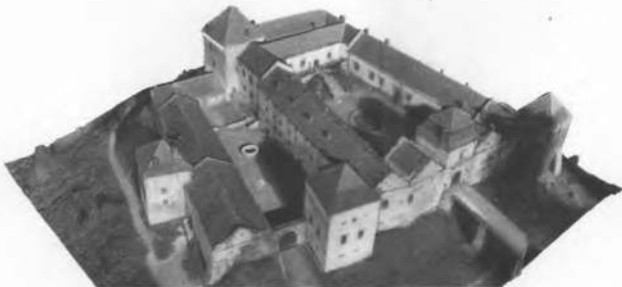
Рис. 8. Аерофотограмметрія.