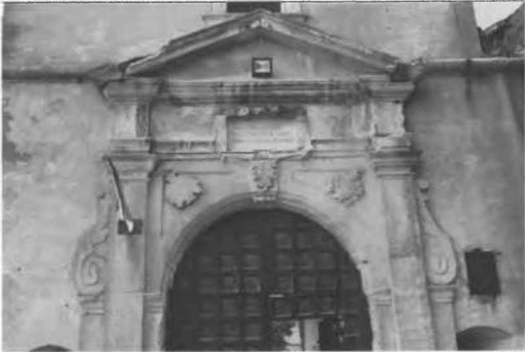
Рис.27. Фрагмент брами головного фасаду.