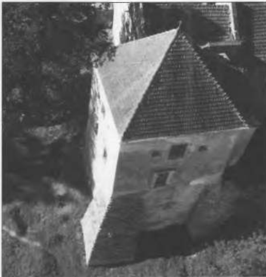
Рис. 16. Східна башта, вид зверху.