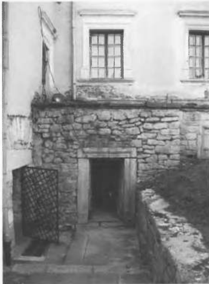
Рис.28. Фрагмент західного кута верхнього двору.