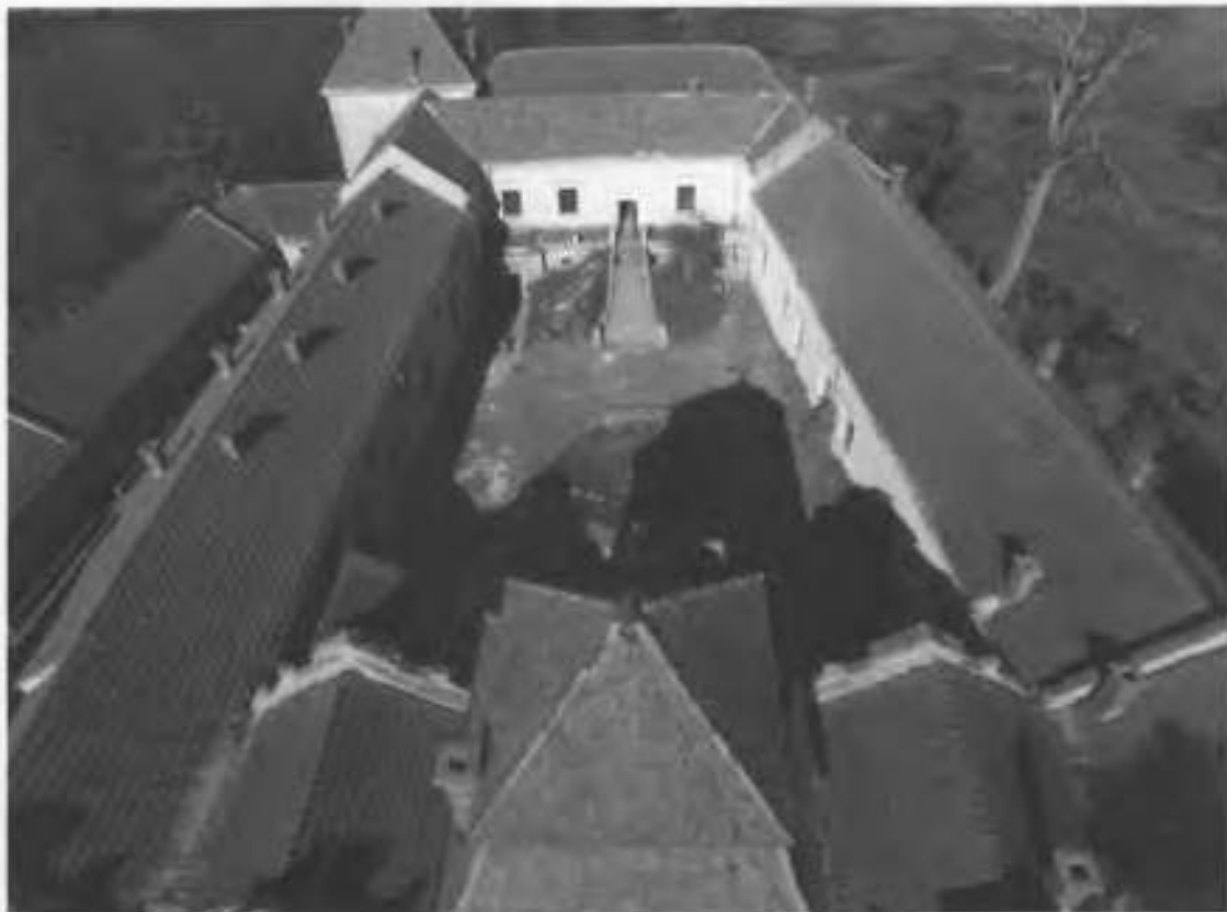
Рис.14. Великий внутрішній двір.