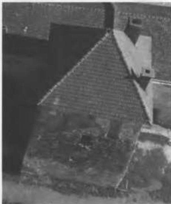
Рис.22. Південно-західна башта