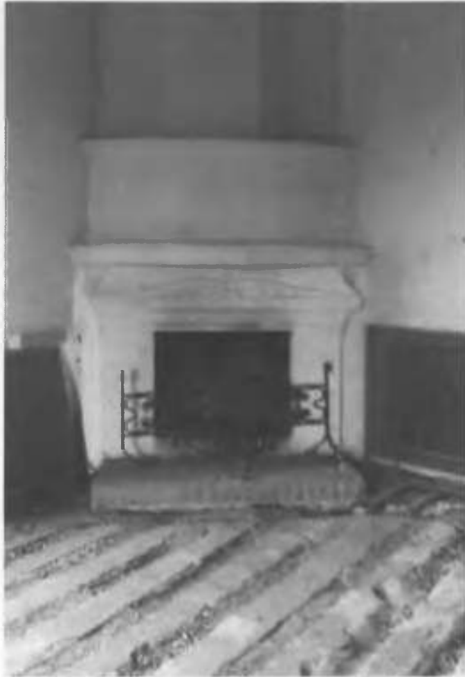
Рис.37. Фрагмент каміну в інтер'єрі замку.