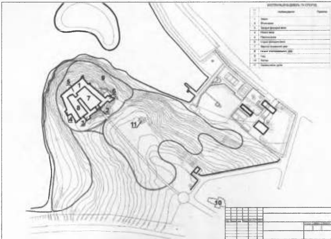
Рис.2. Генеральний план.