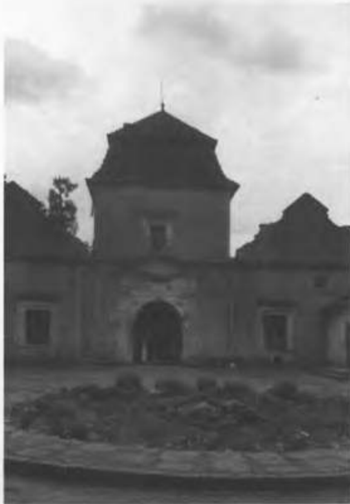
Рис.24. Візна вежа. Вид з двору.