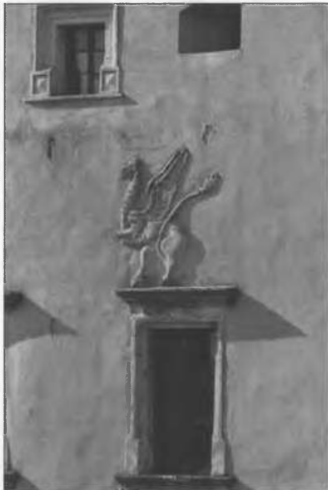
Рис.26. Деталь північно-східного фасаду.