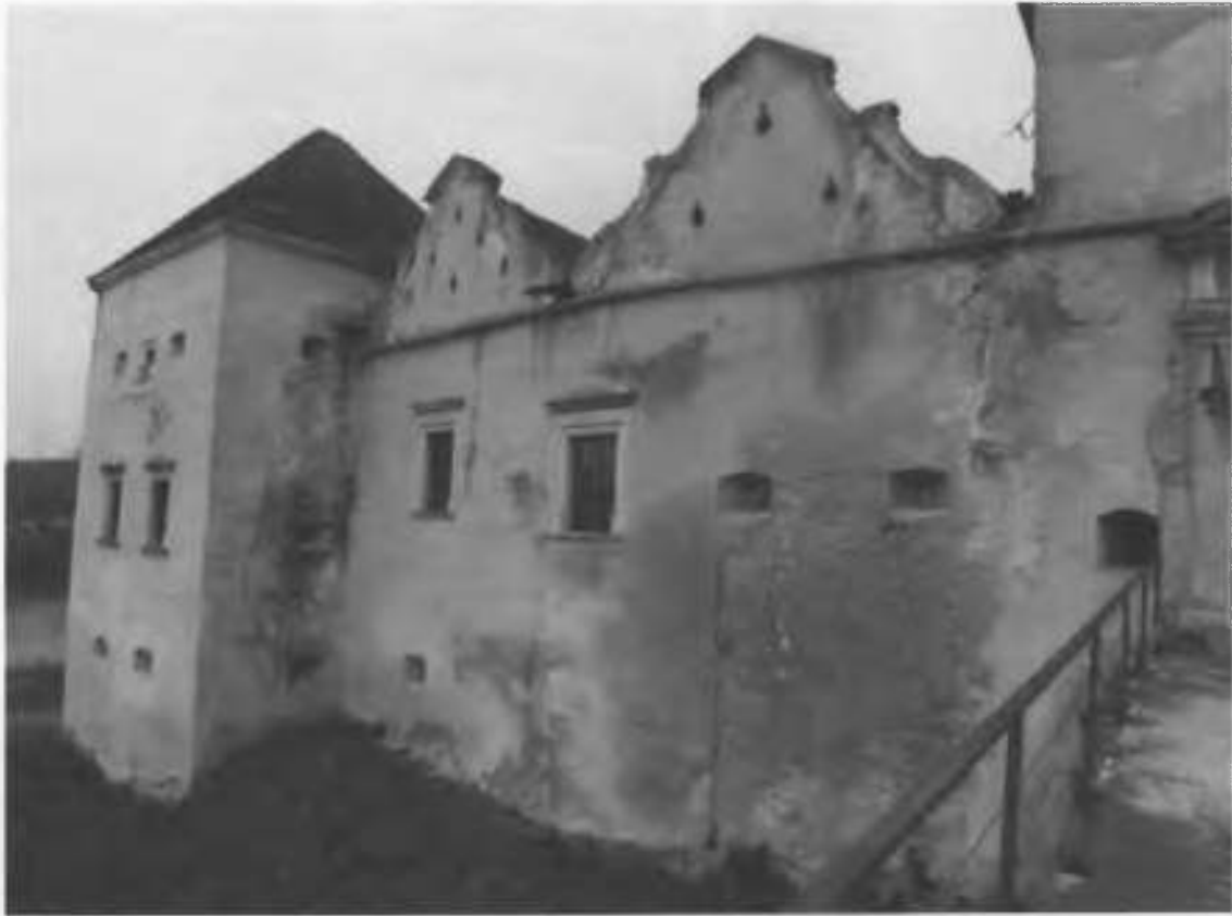
Рис.11. Загальний вигляд фасаду замку в осях 4-14.