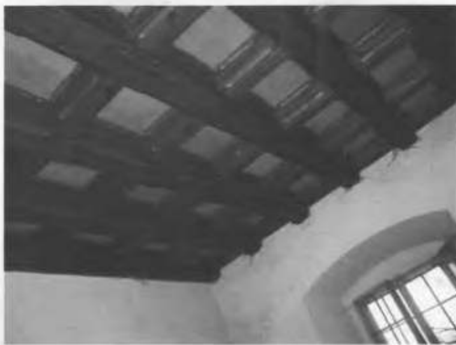
Рис.32. Фрагмент стелі.