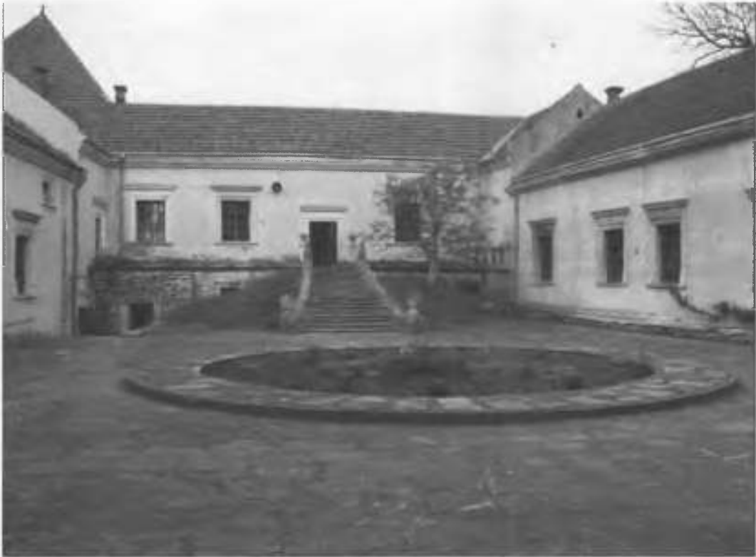
Рис.23. Північно-західний корпус верхнього двору.