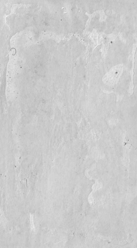
фото 1952 г.