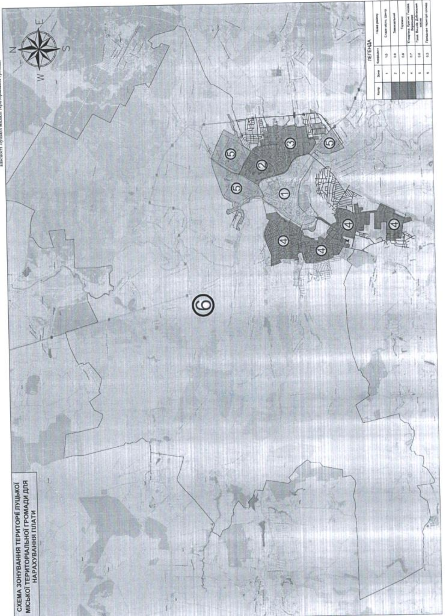
СХЕМА ЗОНУВАННЯ ТЕРИТОРІЇ ЛУЦЬКОЇ МІСЬКОЇ ТЕРИТОРІАЛЬНОЇ ГРОМАДИ ДЛЯ НАРАХУВАННЯ ПЛАТИ

Додаток до Порядку визначення розміру плати за тимчасове користування місцем розташування рекламних засобів, що перебуває у комунальній власності Луцької міської територіальної громади