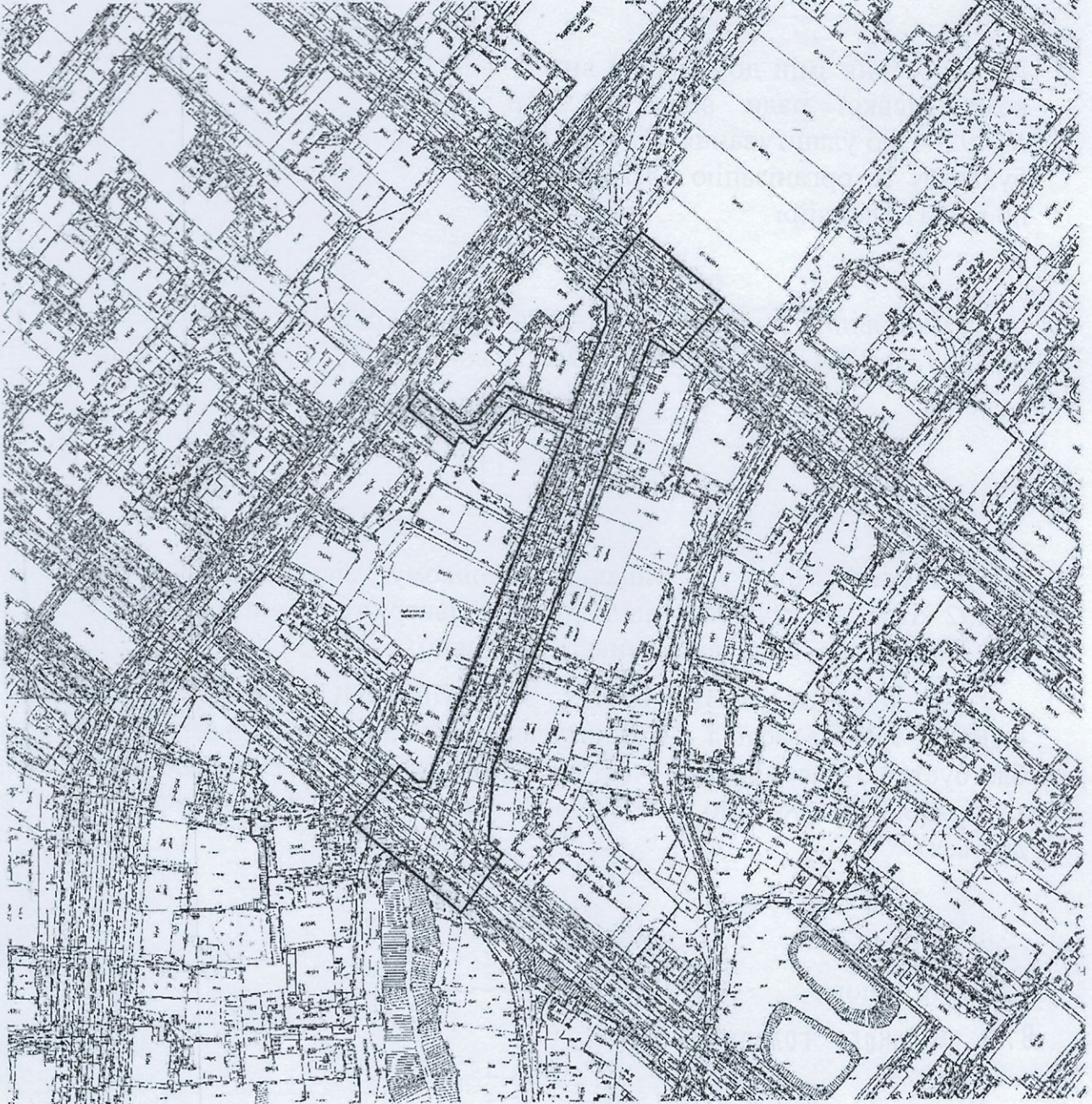
Схема улаштування пішохідного бульвару та організація благоустрою з елементами (частиною) об'єктів благоустрою по вул. Південній

Заступник міського голови з питань діяльності виконавчих органів, директор департаменту благоустрою та інфраструктури Дніпровської міської ради