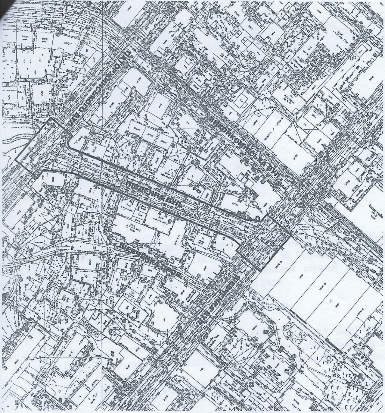
Схема розташування об'єкта